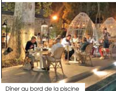
Dîner au bord de la piscine